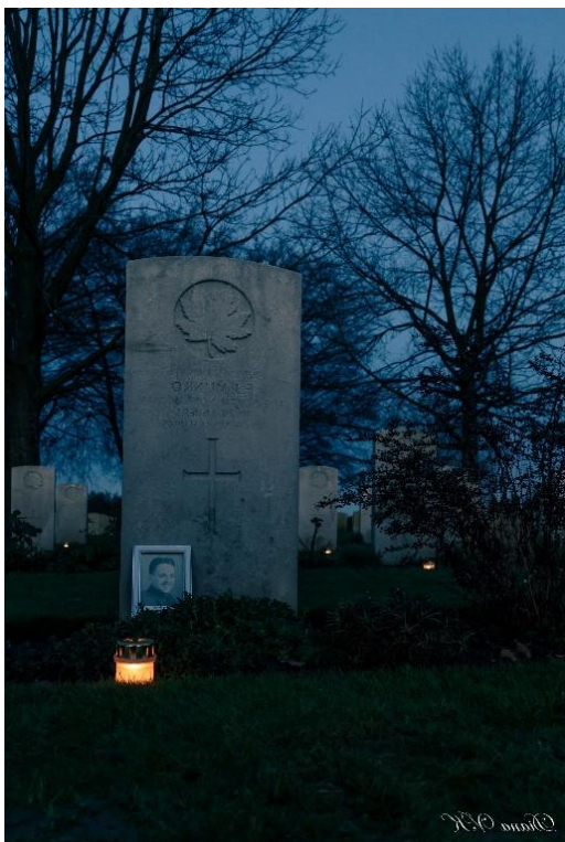
Lichtjesavond 24 december 2018.

Commonwealth War Graves Commission Library and Archives Canada Corina O'Hearn